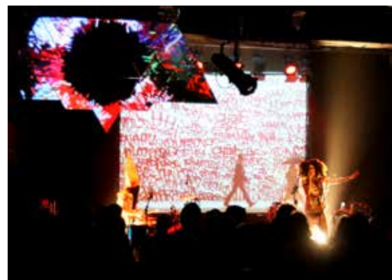
Concert de Oy