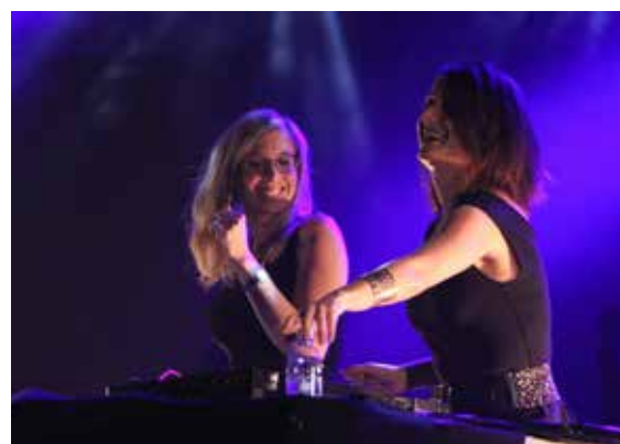
DJ set avec Alkalines