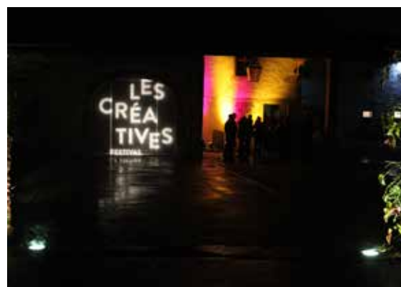
Entrée de la Salle du Manège, Onex